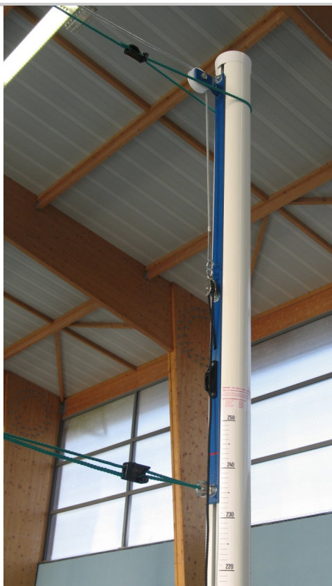
Poteau aluminium à cabestan, réf. VB090108